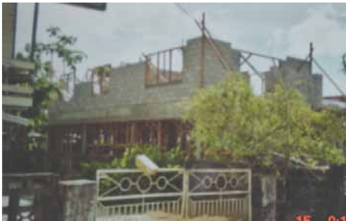
Halverwege de bovenbouw