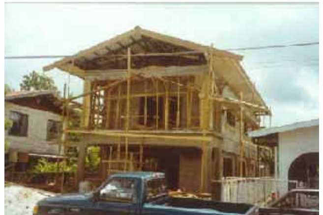
Halverwege de bouw